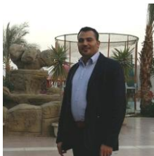
مستشار اللجنة الرياضية