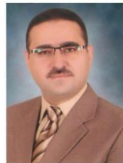
مستشار لجنة الأسر