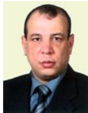
مستشار اللجنة الثقافية